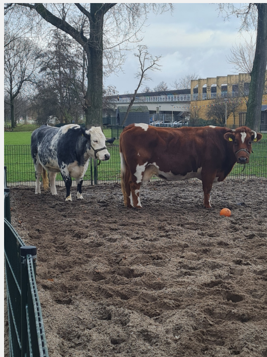
De 2 koeien van de boerderij

Voor elke leeftijdsgroep zijn er diverse lessen beschikbaar, waarbij de nadruk ligt op beleven, ontdekken en leren op een speelse manier. Wil je met je klas een les volgen? Raadpleeg het educatiepagina voor meer informatie of bel het lescentrum op 010 - 2622838.